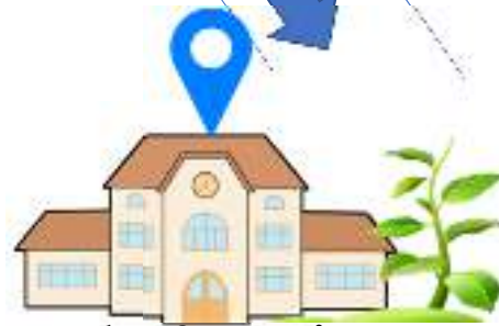
องค์การบริหารส่วนตำบล กกปลาชีวะ