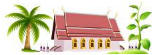
วัดบ้านกกปลาชีวะ