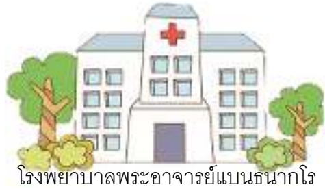
โรงพยาบาลพระอาจารย์แบนธนาโคร