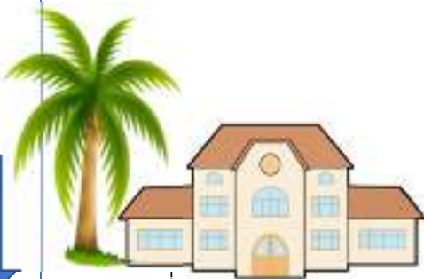
ที่ว่าการอำเภอภูพาน