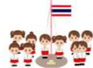
โรงเรียนบ้านกกปลาชีวนาได้