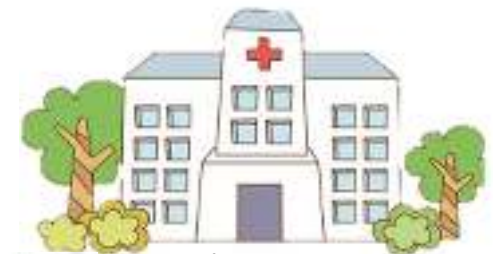
รพสต.ตำบลกกปลาชีวะ