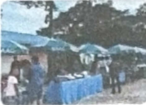
ตลาดนัดชุมชน